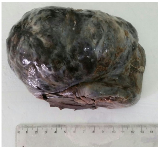
Figura 1: Imagen macroscópica del tumor, tamaño total de 23x13x8.9cm.

Los cortes histológicos muestran un proceso tumoral ovárico con infarto rojo (hemorrágico) masivo. Tras cortes seriados del material se observan zonas viables con cúmulos de células epiteliales, separadas por un denso estroma fibrótico, con zonas de calcificación, en inflamación crónica (ver Figuras 3, 4). Con dichos hallazgos se sugiere diagnóstico de tumor ovárico epitelial tipo Tumor de Brenner (células transi-