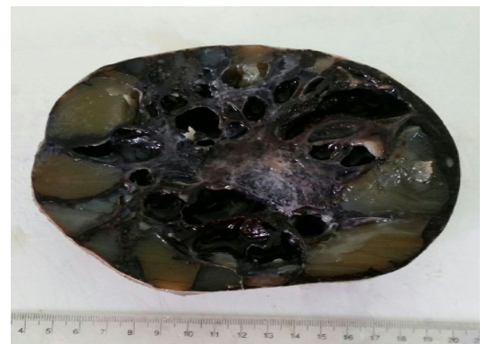
Figura 2: Corte macroscópico en el que se visualizan zonas blanquecinas grisáceas irregulares y quistes conteniendo material gelatinoso.