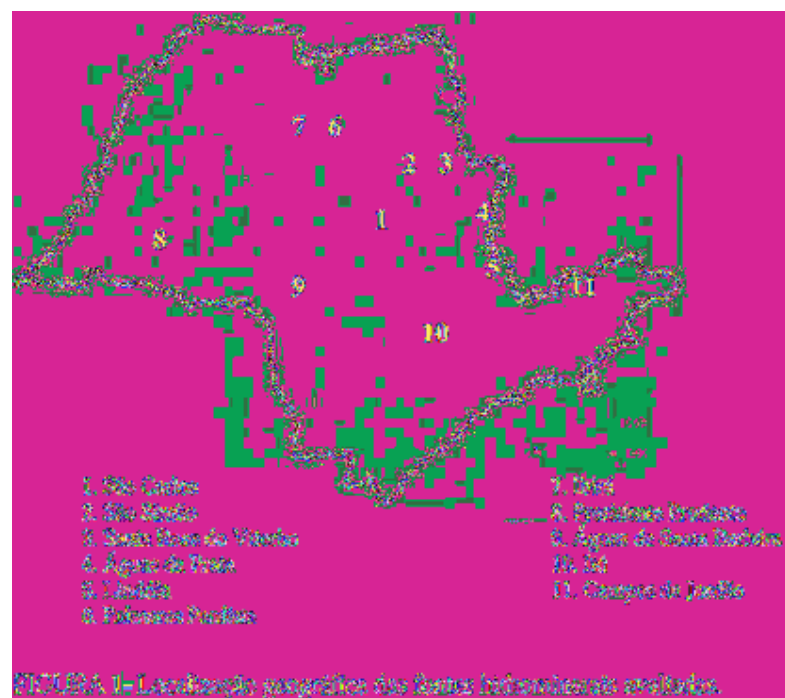
FIGURA 1- Localização geográfica das fontes hidrotermais coletadas.