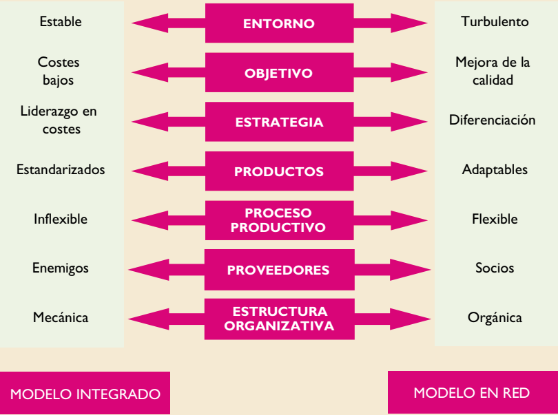
Figura 1. Principales características distintivas de los modelos organizativos de la producción integrados y reticulares.