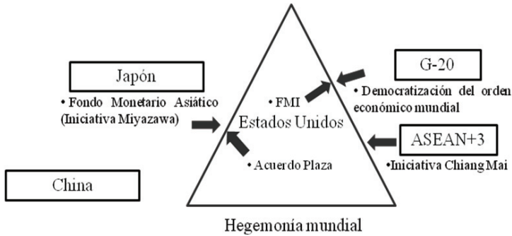
Figura 2 Dinámica de los actores, crisis financiera asiática 1997-1999

Fuente: elaboración propia con base en la presente investigación.