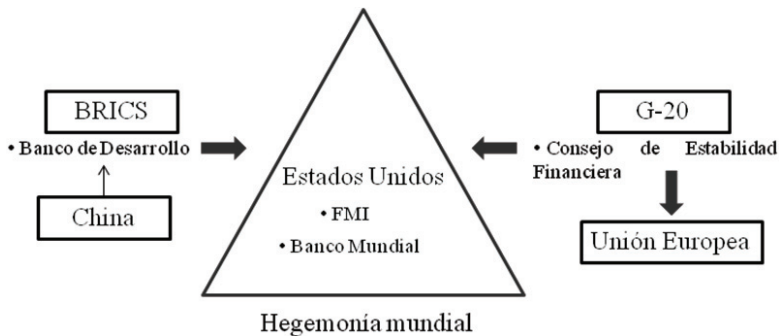
Figura 3 Dinámica de los actores, recesión global financiera 2008-2010

Fuente: elaboración propia con base en la presente investigación.