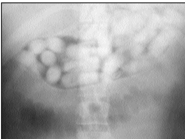
Figura 1. Óvulos en cámara gástrica (radiografía simple de abdomen).

rabdomiolisis. Al sexto día fue extubado. Al 8º día, estaba afebril, con buena evolución clínica, tolerando dieta, y expulsó los últimos óvulos. (figura 2). El paciente confirmó que transportaba 100 óvulos de heroína (el peso registrado oficialmente fue de 1.4 kilos, 14 gramos por óvulo). El valor estimado para dicha droga era de $112.000 (41 millones de colones).