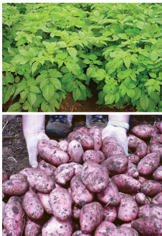
Fig. 1. Aspecto de las plantas en el campo y los tubérculos de la variedad de papa Désirée.

el campo vigoroso, que alcanza de 50 a 60 cm de altura. Produce flores de color violeta claro en abundancia media, estolones muy cortos y tubérculos ovalado-largos, de piel lisa y color rojo brillante; los cuales presentan un período de dormancia medio (2,5-4 meses). La carne del tubérculo es color crema y los ojos son superficiales. Los tubérculos son grandes y bastante uniformes cuando la planta madura y se producen en abundancia mediana en el campo (15-20 tubérculos por planta). La figura 1 muestra las características