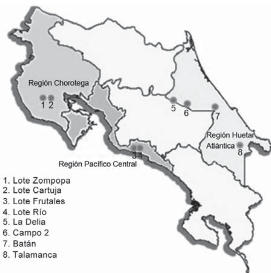
Figura 1. Sitios de muestreo de suelo para la identificación de hongos nematofagos de las regiones arroceras Chorotega, Pacífico Central y Huetar Atlántica. Costa Rica, 2008-2009.

En total se realizaron trece giras de campo durante los meses de abril del 2008 a enero del 2009 (Figura 1). Para el aislamiento de los hongos nematofagos se delimitaron en cada finca tres áreas de muestreo de 4 m 2 separadas entre sí por una distancia de 50 m. En cada punto de muestreo, se recolectó con la ayuda de un barreno cinco submuestras a una profundidad de 20 cm. Las muestras fueron almacenadas en bolsas de polietileno debidamente etiquetadas y trasladadas al Laboratorio de Ecología de Organismos del Suelo y Control Biológico para su debido procesamiento. Con la ayuda de un GPS se determinaron las coordenadas de cada punto de muestreo.