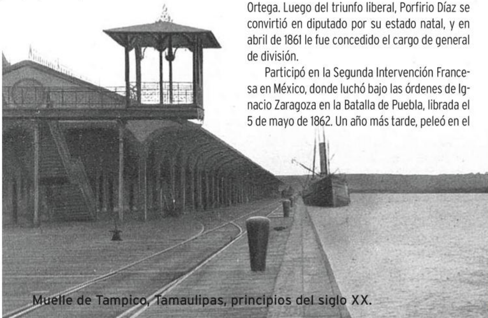
Muelle de Tampico, Tamaulipas, principios del siglo XX.