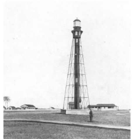
El faro de la Barra en Tampico, Tamaulipas, finales del siglo XIX.

En la desembocadura del río Pánuco en 1823 y luego de varios intentos por los constantes