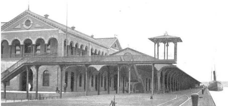
Aduana y muelle de Tampico, Tamaulipas, principios del siglo XX.