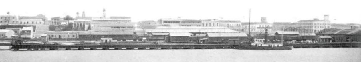
Fotografías de Tampico: Alba, R. (1) Tamaulipas: reseña geográfica y estadística. México: Librería de la de C. Bouret.

Puerto de Tampico, principios del siglo XX.