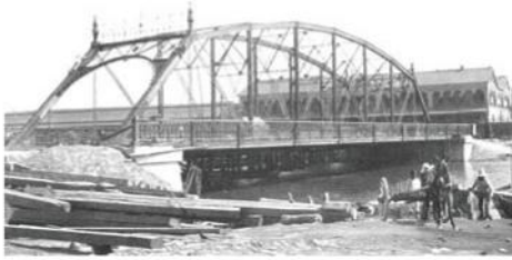
Puente El Moralillo en Tampico, Tamaulipas, finales del siglo XIX.