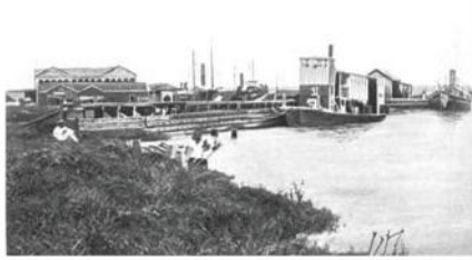
Muelle del Tritón en Tampico, Tamaulipas, principios del siglo XX.

de ferrocarril que, prácticamente la red ferroviaria era de la capital del país a Veracruz.