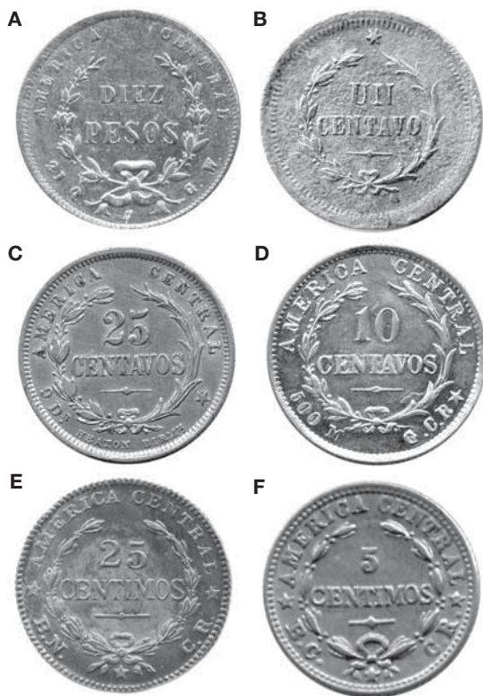
Fig. 7. Reversos de monedas de Costa Rica con coronas atadas en su base con una cinta (1870-1951): A. Diez pesos, oro, 1870, 29 mm, acuñada por la Casa de Moneda de San José. Corona hecha con dos ramas de mirto ( M. communis ). B. Un centavo, aleación cupro-níquel, 1874, 20 mm, Casa de Moneda de San José. Corona hecha con una palma semi cerrada y una rama de mirto. C. Veinticinco centavos, plata, 1892, 25 mm, acuñada por Heaton, Birmingham, Inglaterra. Corona hecha con ramas de mirto y palma. D. Diez centavos, plata, 1917, Philadelphia Mint, EE.UU. El anverso está incluido en la Fig. 8 D. E. Veinticinco céntimos, latón, 1946, 23 mm, Casa de Moneda de San José. Corona hecha con dos ramas de mirto. F. Cinco céntimos, cupro-níquel, 1951 (tipo 1), 15 mm, Philadelphia Mint, EE.UU. Corona hecha con dos ramas de mirto (última moneda de Costa Rica en que se grabó una corona de mirto).

de coronas grabadas en monedas de Costa Rica. La última moneda de Costa Rica con una corona de mirto fue la de cinco céntimos (Troquel I) de 1951 (Fig. 7 F). No obstante, a partir de 1935 se empezó a grabar, en las monedas de 25 y 50 céntimos y de un colón, una corona formada por dos ramas (bandolas) de café ( Coffea arabica ) entrelazadas en su base. Este modelo de corona se utilizó hasta 1995 y luego