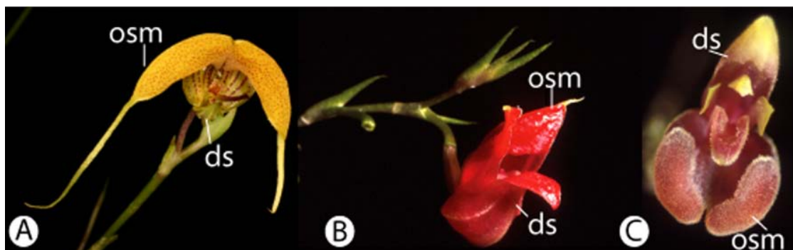
FIGURA 1. Diversidad floral de Scaphosepalum . A. S. decorum ; B. Flor tubular de S. odontochilum ; C. S. medinae . osm: osmóforos, ds: sépalo.