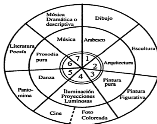
Figura 1. Correspondencias de las artes (Souriau, 1998, p. 122)

Pese a gozar de fama en las investigaciones interartísticas, dicha propuesta no está exenta de problemas según los teóricos. En esta línea, resulta de gran interés por el entramado metadiscursivo que presenta el sistema alternativo de intersecciones planteado por Victoria Llort (2011, pp. 91-101) en La memoria de las musas . Mientras que el esquema de Souriau aleja a las artes de su centro de gravedad, al avanzar por cada círculo en un movimiento centrífugo, el sistema de Llort procura reunir las, según ella misma afirma. Se nos ofrece aquí una nueva e interesante vía de estudio interdisciplinar, que da cuenta de los procesos transartísticos y prepara metodológicamente un significativo acercamiento a las fases de comprensión e interpretación artística.