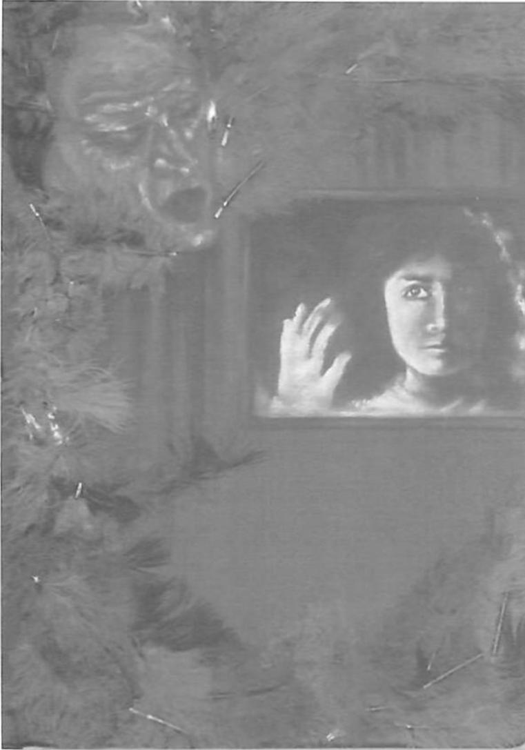
Laura Contreras Martínez, Ciudadano de dibujos, 2007, mixed media, 26.5 x 19 cm.

Recordar que la esencia y la más pura naturaleza del rock se encuentran en la rebeldía no tiene por qué ser un sueño utópico pasado de moda o una ideología ya gastada. Recordemos que en muchos aspectos de la vida nos debemos a la rebeldía, por ser una capacidad que nos