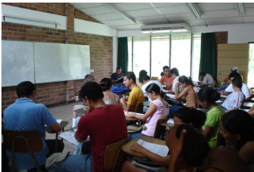
Foto tomada en Sede Regional de Guanacaste

A final del primer semestre de 2006, se realizó una prueba piloto al instrumento en la población estudiantil. Dicho ensayo incluyó en total 35 estudiantes: 2 asistentes del Centro de Evaluación Académica, 7 seleccionados al azar en la Sede Central, y 26 pertenecientes a un grupo de Ingeniería. Para responder, los y las jóvenes emplearon en promedio 25