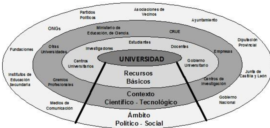
Figura 1: Tipos de partes interesadas entrevistadas durante la investigación, según ámbito o contexto.