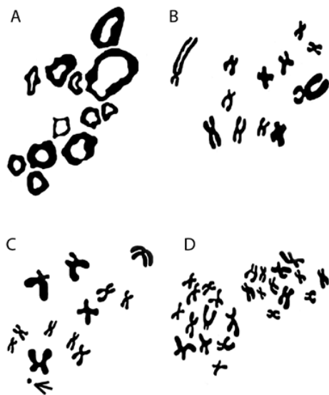
Fig. 2. Dispersiones cromosómicas bivalentes tempranas de S. baudinii con 12 cromosomas profásicos II en forma de anillo (A), 12 cromosomas metafásicos II (B), 12+1 cromosoma "B" (flecha) en metafase II (C) y 24 cromosomas en metafase I (D).

Fig. 2. Early bivalent chromosome spreads from S. baudinii with 12 chromosomes ring shaped at prophase II (A), 12 chromosomes at metaphase II (B), 12+1 "B" chromosome (arrow) at metaphase II (C) and 24 chromosomes at metaphase I (D).