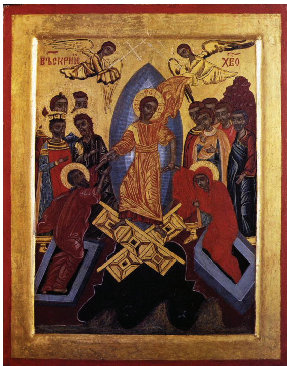
Figura 4 – Representação oriental da Anastasis (ressurreição) por um pintor desconhecido da Bulgária (1675-1700)

de amarelo, de frente para o Cristo) cai violentamente. Ele e o Cristo formam um grande eixo ao longo de toda a imagem. Os guardas dessa imagem apresentam uma reação totalmente inusitada e diferente em relação aos que descrevemos anteriormente. Com suas mãos levantadas aos céus, eles parecem ter sido tomados por êxtase religioso . Uma representação de transe encontramos também em outra pintura de El Greco, nos remidos na Abertura do quinto selo . Esses guardas, longe de representar o poder romano que vigia o sepulcro, representam a humanidade, reconhecendo na ressurreição de Jesus sua própria libertação. Essa imagem é tomada por um clima místico. O observador do quadro poderia se identificar plenamente com eles.