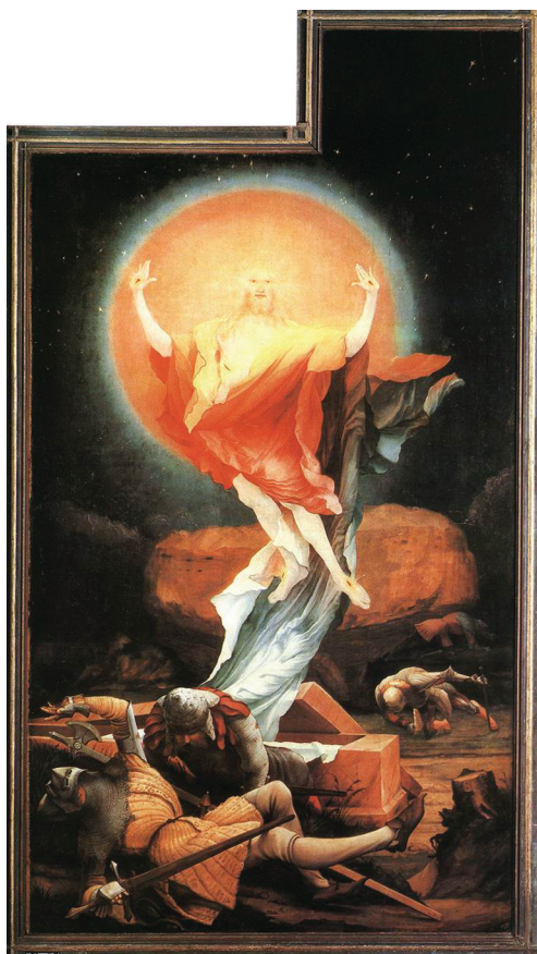
Figura 2 – Ressurreição – Altar de Isenheim, de Matthias Grünewald (1480-1528, Alemanha).

arma em punho. Outro se volta de costas. Um terceiro reconhece a manifestação divina e se prostra de joelhos. É interessante que a explosão de luz e a saudação triunfante do Cristo não ocultam as marcas de sua morte. Suas mãos trazem as marcas dos pregos e seu peito traz a marca da lança. Há algo de divino e de humano nessa representação. Podemos imaginar como os enfermos (doentes de peste) do hospital de Isenheim contemplariam essa representação de um morto que retorna à vida.