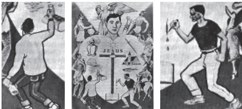
FIGURA 36 - 1985: Gossner [edição de África do Sul]; Figuras na esquerda e na direita são partes da mesma Figura

Observa-se que, especialmente, os emblemas com corações ocos como representações humanas reduzem o mundo ao seu redor a dois aspectos: uma presença angelical ou do diabo e de demônios. Em geral, o ambiente é reduzido à dicotomia entre o bem e o mal. São esses “mundos” que interagem com a pessoa e a pessoa com eles. Não há um campo neutro, por exemplo, baseado na distinção da teologia antropológica da imagem de Deus entre as imagens natural, política e moral. No ser humano, não há setores de relativa autonomia. Tudo é relacionado com o mal e o bem (também as Figuras 13, 25 e 26).