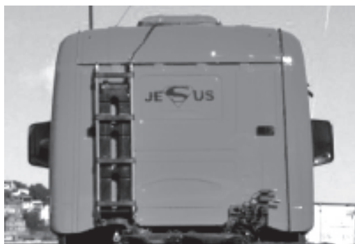
FIGURA 33 - 2009: Logotipo de Superman combinado com o nome Jesus