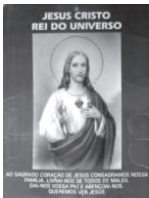
FIGURA 32 - 2009: Caderno Jesus Cristo, Rei do Universo , numa cadeira numa entrada em São João del Rei