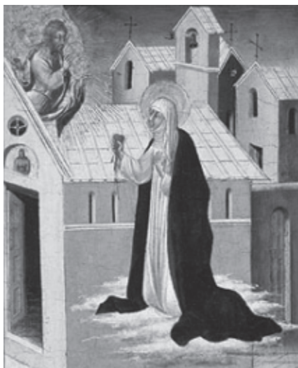
FIGURA 25 - cerca de 1460: Catarina de Siena trocando seu coração com Jesus

Deixando de lado as reproduções das obras de Wierix e de Hugo Hermann por luteranos e anglicanos, prevalece na iconografia protestante – como a pentecostal e neopentecostal – a identificação do coração com o ser humano. Já vimos duas representações em que dois corações aparecem. Nesses casos, trata-se de uma troca de corações, do coração humano pelo coração divino. O que é conhecido no ambiente católico reaparece na mística de Jacob Boehme (1575-1724) na capa do seu livro De Testamentis Cristi (BOEHME, 1623).