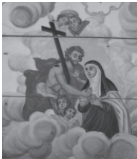
FIGURA 26 - entre 1766-1772: Teresa de Ávila, trocando seu coração com Jesus

Fonte: Wikipedia. Disponível em: < http://upload.wikimedia.org/wikipedia/commons/7/73/Giovanni_di_Paolo_Saint_Catherine_of_Siena_Exchanging_Her_Heart_with_Christ.jpg >. Acesso em: 23 mar. 2009.