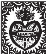
FIGURA 8 - Séc. XVII: O sagrado Coração de Jesus segundo Margarida Maria Alacoque

Paralelamente, estabelecem-se a partir da França duas novas linhas da religião do coração. A primeira, baseada em François de Sales (1567-1622) como Jean Eudes (1601-1680) e estampada pela freira salesiana Margarida Maria Alacoque (1647-1690), leva a uma nova forma de devoção ao sagrado coração de Jesus. Repare que na Figura 8, relacionada com M. M. Alacoque, aparecem a palavra caritas , amor, três pregos como lembrança da crucificação, a própria cruz e, ao seu redor, chamais.