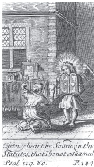
FIGURA 38 - 1624: Emblema do livro Pia Desideria , livro 2 capítulo 6, p. 104 de Hugo Herman, edição inglesa

Fonte: Google Books. Disponível em: < http://books.google.com.br/books?id=uyc3AAAAMAAJ&pg=PP7&dq=HERMANN,+Hugo.+Pia+Desideria#PPA104,M2 >. Acesso em: 23 mar. 2009.