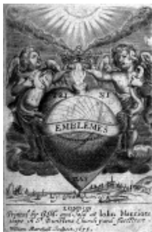
FIGURA 23 - 1635: Capa do livro Emblems, divine and moral de Francis Quarles.

O coração representa ou a divindade ou o ser humano, no caso das imagens com dois corações, tanto Deus como o ser humano. Na Figura em seguida (Figura 23), o coração representa a Trindade que engloba todo o universo (QUARLES, 1635). Talvez transpareça aqui a clássica ênfase da teologia anglicana na criação.