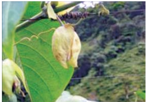
Figura 3. Daño causado por Dasiops inedulius en botones de granadilla

Daño en flor. En la flor, el insecto realiza la oviposición directamente en la parte media del ovario y al igual que en el botón floral la hembra permanece posada sobre la flor varios minutos mientras realiza la oviposición (figura 4). Una vez la mosca abandona la flor, en el sitio del ovario