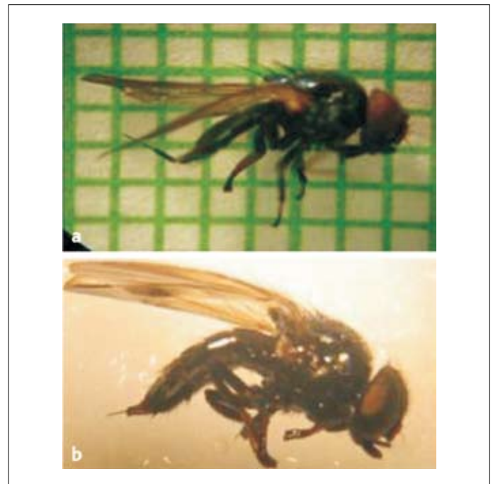
Figura 2. a. Dasiops inedulis . b. Dasiops yepezi

Por otra parte, se detectaron cinco especies de parasitoides actuando sobre D. inedulis durante la cría establecida en casa de malla. Los parasitoides adultos emergidos de pupas fueron identificados por el doctor Paul Hanson, de la Universidad de Costa Rica: Pentapria sp. (Hymenoptera: Diapriidae) parasitoide de Stratiomyidae (Master y García, 2002), Pachycrepoideus vindemmiae