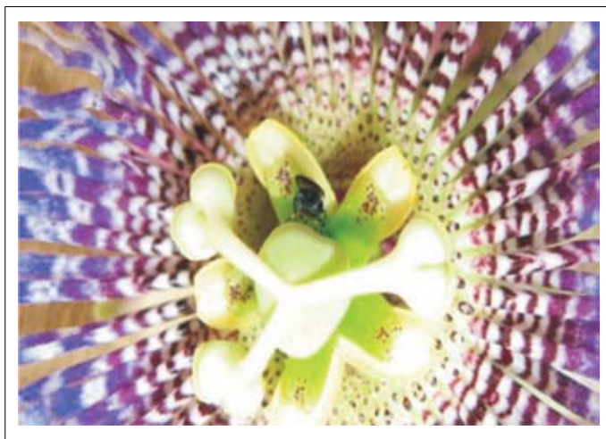
Figura 4. Mosca del botón floral Dasiops inedulius ovipositando sobre ovario de flor de granadilla

donde ha dejado la postura, se observa un pinchazo, lesión que es característica de una previa oviposición. El daño en flores es muy diferente que en botones florales según lo registrado por Ambrecht y colaboradores (1986).