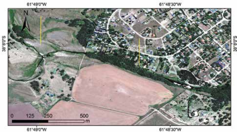
Figura 2. Tramo seleccionado para la aplicación del Índice Hidrogeomorfológico