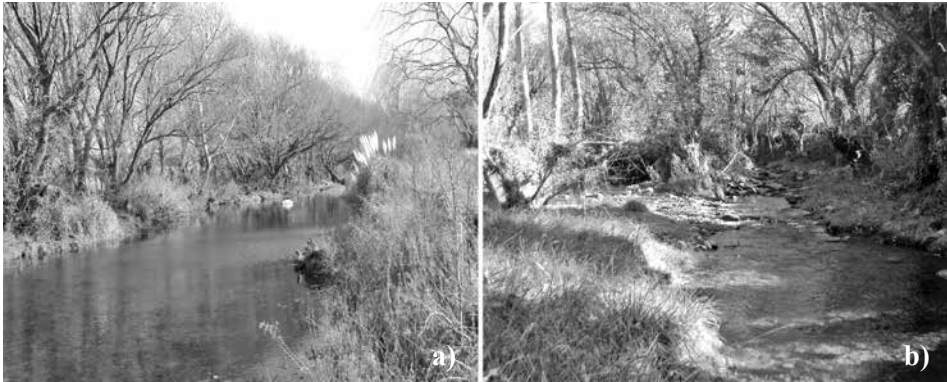
Figura 6. Riberas naturales