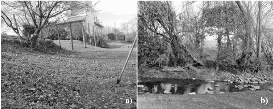
Figura 4. Funcionalidad de la llanura de inundación