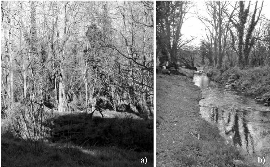
Figura 5. Naturalidad del trazado y de la morfología en planta