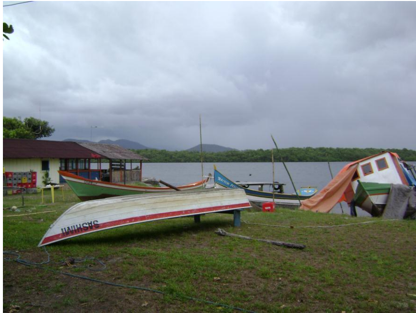
Figura 3. Embarcações dos Moradores. No primeiro plano podemos observar parte das embarcações dos moradores locais. No segundo plano está o Canal do Ararapira e em terceiro plano observamos a Ilha do Superagui, PR, uma região de Mata Atlântica.

Ressaltamos que no encontro das águas do Canal com as terras do Superagui, há formações de um dos mais ricos ecossistemas: o mangue.