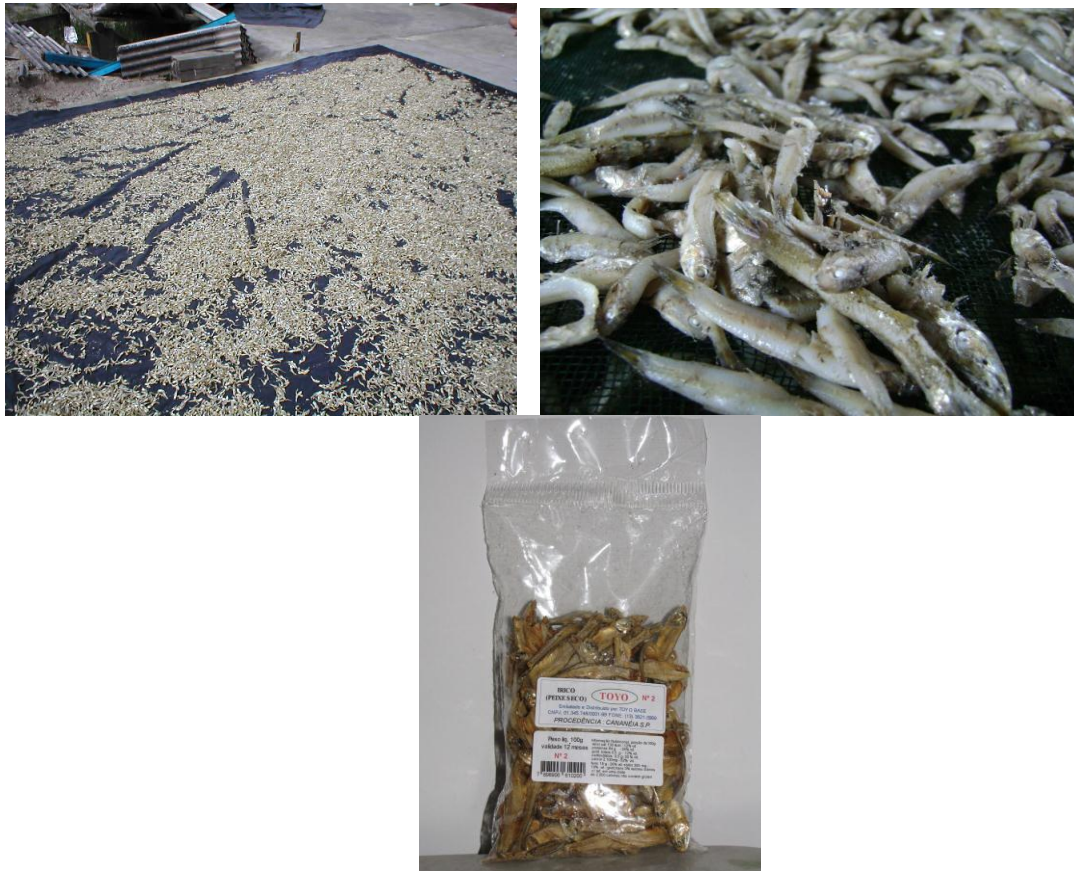
Figura 4. Irico. O irico representa uma importante complementação de renda para os moradores locais, A fotos mostram as fases do resultado da pesca do irico, desde a secagem até a comercialização. O pescado (a e b) é classificado pelos n os 0,1, 2 e 3, conforme o tamanho do peixe, em centímetros. Na comercialização (c) a variação de tamanho está relacionada à diferenciação do preço: quanto menor a remuneração é melhor. Um morador informou que o processo de salga é natural, onde não é adicionado sal durante a secagem. Apenas o sal encontrado nas águas do canal é suficiente para a conservação do produto.

território do canal para o encontro dos cardumes, além de ser uma tradição passada de pai para filho. É praticada por toda a região do estuário,