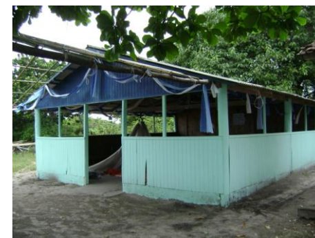
Figura 2. Vista Panorâmica da Comunidade. Nas imagens acima podemos observar a vista panorâmica da comunidade Enseada da Baleia, registrada pelo Canal da Barra do Ararapira. Abaixo (da esquerda para direita) os detalhes: Centro Comunitário, Capela, Píer e Bar/Restaurante de propriedade do sr. Malaquias.