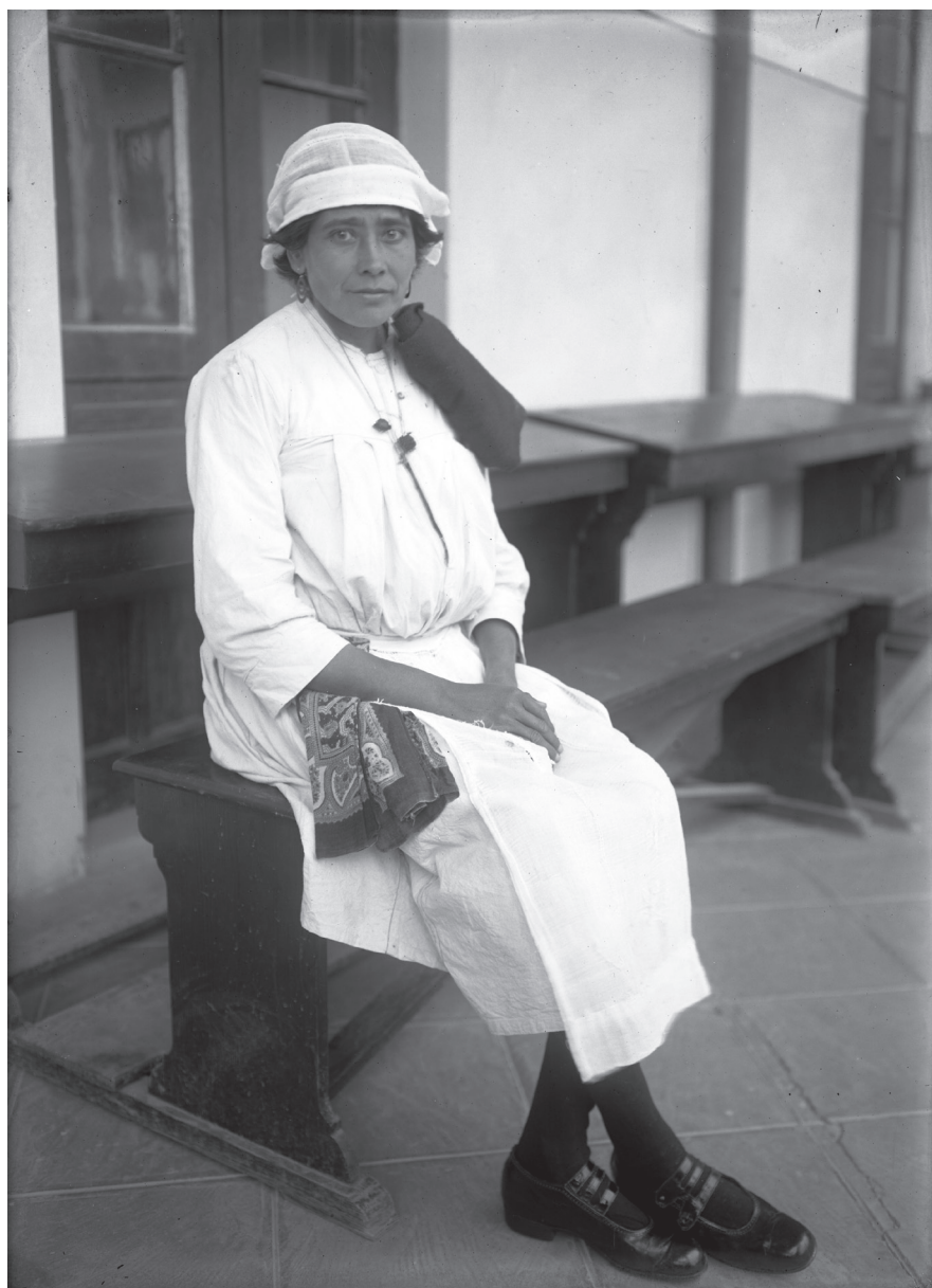
"Mujer, retrato" (placa seca de gelatina: 12.7 x 17.8 cm.), México, D.F. ca. 1915-1920.