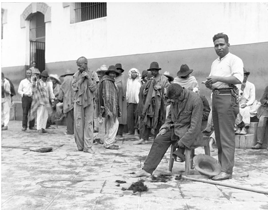
“Peluquero corta el cabello a interno de La Castañeda” (negativo de película de nitrato: 12.7 x 17.8 cm.), México, D.F. c. 1935. © CONACULTA.INAH.SINAFO.FN.MÉXICO, Archivo Casasola, No. Inv. 366986.