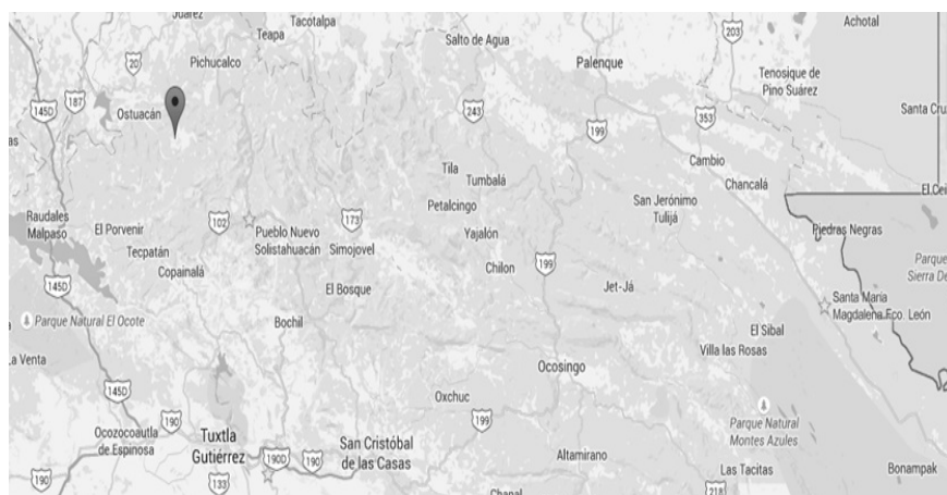
Mapa 1. Área Zoque en el estado de Chiapas

Keywords: El Chichonal, Zoquean People, Regional Dynamics, Indigenous Young People, Collective Memory.