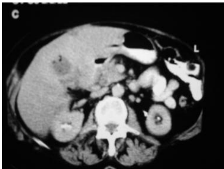
Figura 1. Vesícula con lodo biliar y aire. No se observan cálculos. La pared duodenal se encuentra engrosada

Mujer de 74 años de edad sin antecedentes de importancia; hipertensa desde dos años antes, controlada con 25 mg de captopril; gesta 18, para 18, abortos y cesáreas 0. Acudió por tumoración en cuadrante superior derecho de abdomen desde 15 días antes, sin cólico posterior a ingesta de alimentos colecistoquinéticos, ictericia o fiebre. Los exámenes de laboratorio fueron normales. Un ultrasonido mostró engrosamiento de 7 mm de la pared vesicular y varios cálculos. En la tomografía axial computarizada de abdomen se encontró aire en vesícula y vías biliares (figuras 1 y 2).