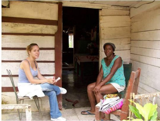
Figura 2. Entrevista realizada a uno de los habitantes de la Comunidad 3, en la zona alta de la Gran Piedra, Santiago de Cuba, Cuba.