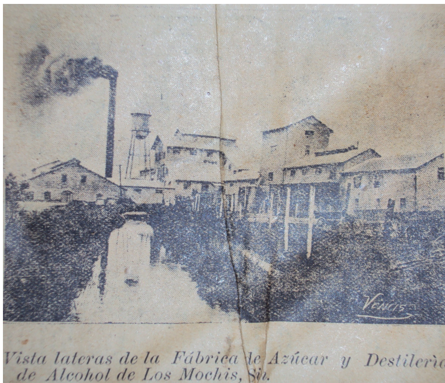
IMAGEN I.- EL INGENIO AZUCARERO DE LOS MOCHIS DE LA UNITED SUGAR COMPANIES