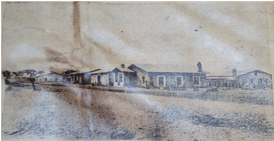
Colonia obrera "Inez."—Estas casas las construye la United Sugar Companies, S. A., para sus obreros, a quienes les abona el 50 % de su costo, después que aquéllos han cubierto el otro 50 % en 10 anualidades.