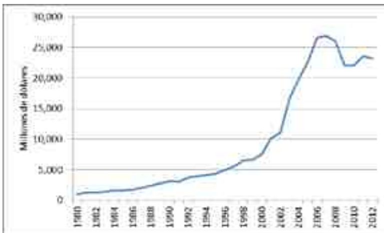
Gráfica 1. México: ingresos por remesas, 1980-2012.

Fuente: elaboración propia con base en información del Banco Mundial.