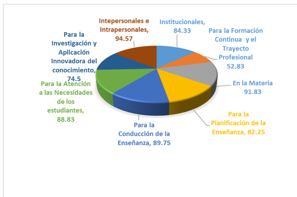
Figura 3.- Resultados de las 8 competencias para la Evaluación de Desempeño del Docente Frente a grupo de la CyBENP, Estudio Piloto.

Los resultados obtenidos para la prueba piloto, considerando a los cuatro docentes permiten observar que de las ocho competencias evaluadas, la que requiere atención y emprender acciones de mejora es la Competencia para la Formación Continua y Trayecto Profesional con un 52.83%, por el contrario, la competencia que se presenta con un más alto porcentaje es la inter e intrapersonal con 94.57%, seguida de la Competencia en la Materia con el 91.83% ( Figura 3 ). De esta manera, se pudo observar que las necesidades de capacitación de manera general, están en torno a la innovación en la enseñanza, el uso de las Tecnologías de la Información y la Comunicación, el dominio del inglés, la creatividad, la redacción de textos científicos e investigación, además de hacerse necesaria la conformación de redes y la vinculación entre los cursos o asignaturas que se imparten por semestre.