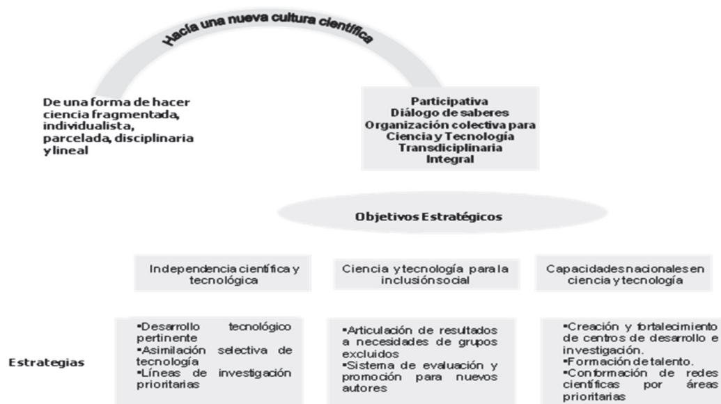
Figura 2. >>> La nueva cultura científica en Venezuela