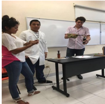
Figura 1: Integrantes del equipo realizando el experimento

En la figura 1 se observa el equipo realizando el experimento.