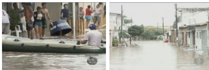
Figura 2 – Exemplos de transtornos à população nas ruas (a) Minas novas; (b) Jerusalém, bairro Neópolis - Natal-RN

A chuva forte que caiu em Natal no dia 22 alagou ruas e abriu buracos na cidade (Figura 3). Como um bom exemplo, pode-se citar a rua Minas Novas que teve um alagamento que se estendeu até a rua Jerusalém, deixando moradores ilhados impossibilitados de sair de casa. Prejudicando comerciantes e moradores. Segundo a Emparn, choveu 95.5 mm na capital Potiguar nas últimas 24 horas.