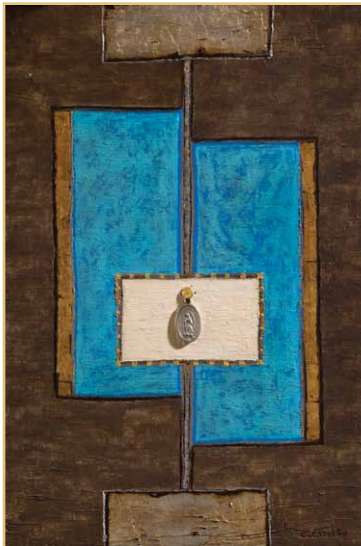
Medalla de Guadalupe

Denominación de la estrategia: Proyecto en Grupo Asignatura: Fundamentos de Marketing