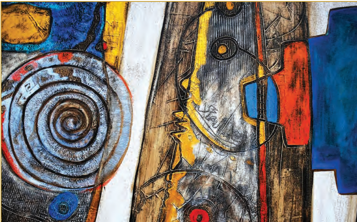
Kawsay-wañuy (Vida-muerte) Mixta 2010

De esta manera, la experiencia religiosa identificada en el documento, trata de confirmar,