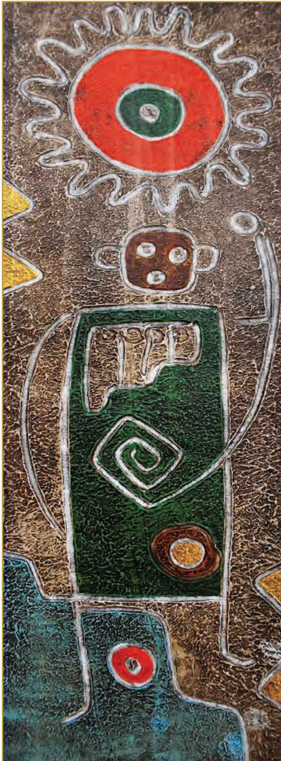
Yuyaykuna (Ideas) Mixta 2010

sentar la vida humana como el centro de la vida social y cultural, resaltando en ella, la dignidad de ser imagen y semejanza de Dios y la vocación a ser hijos en el Hijo, llamándonos a compartir su vida por toda la eternidad (ibíd., n. 480). A partir de esta categoría se exponen algunas indicaciones para la pastoral: