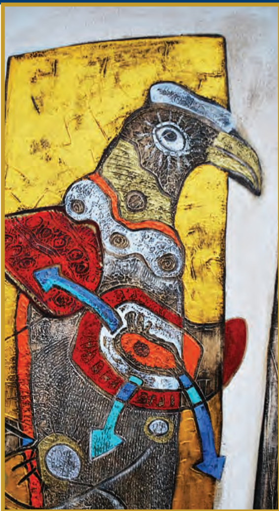
Kuntursunku (Corazón de cóndor) Mixta 2010

Según A. Vergote, la experiencia religiosa, en primer lugar, es identificada como ‘experiencia de lo sagrado’, comprendido como conocimiento intuitivo estable y habitualmente accesible de una realidad sobrenatural presente al mundo y a las personas y que trasciende a ambos. En segundo lugar, como la ‘captación profundamente afectiva’ de una realidad sobrenatural que se revela como novedad que sorprende e interpela al hombre, transformándole duramente o pasajeraamente, constituyendo un acontecimiento que sobreviene al hombre y da nuevo sentido a su vida.