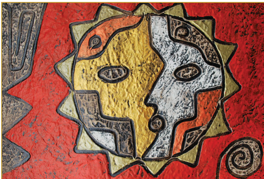
Ishkanti (Los dos) Mixta 2010

Aparecida considera que: “el fracaso de las ideologías dominantes para dar respuesta a la búsqueda más profunda del significado de la vida, ha permitido que emerja como valor la sencillez y el reconocimiento en lo débil y lo pequeño de la existencia” (ibíd., n. 44). Asimismo considera que: “la necesidad de construir el propio destino y el anhelo de encontrar razones para la existencia, puede poner en movimiento el deseo de encontrarse con otros y compartir lo vivido como una manera de darse una respuesta. Se trata de una afirmación de la libertad personal y, por ello, de la necesidad de cuestionarse en profundidad las propias convicciones y opciones (ibíd., n. 53).