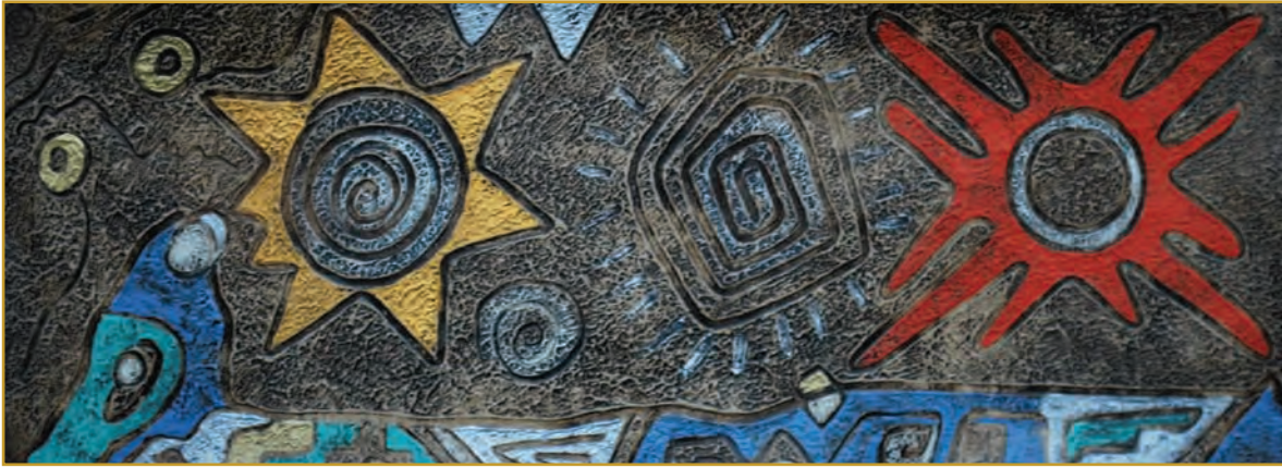
Kuyllurkuna (Estrella) Mixta 2010

ren a algún pequeño signo del amor de Dios, como a un crucifijo, un rosario, una vela que se enciende para acompañar a un ser querido en su enfermedad, un Padrenuestro musitado entre lágrimas, una mirada entrañable a una imagen querida de María, una sonrisa dirigida al Cielo en medio de una sencilla alegría. (ibíd., n. 261).