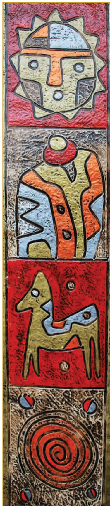
Nuka (Yo) Mixta 2010

Dentro de las orientaciones pastorales que el documento presenta para fortalecer la experiencia religiosa en los jóvenes pone énfasis en ‘la vida y su existencia’. Por tanto, es necesario pre-