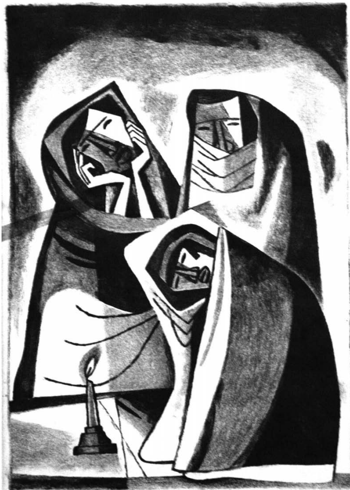
Tres mujeres. 1937

tencional y tiene fe en la ‘educabilidad’ del ‘Otro’; y, a su vez, cuando quiero aprender, siento la confianza que tiene el otro (el maestro) en ‘Mí’. Este equilibrio se demuestra cuando el alumno se encuentra a sí mismo, da sus propios pasos y traduce a la práctica lo que aprehende. El maestro educa con autonomía y está consciente que “Ser autónomo es querer que los demás también lo sean”. 46 La ‘emancipación’, cuyo antónimo “violencia ciega”, 47 así contrastado por Meirieu, que infiere el ‘asistencialismo’ de Freire, es la llamada tanto a la inteligencia como a la libertad del ‘Otro’.