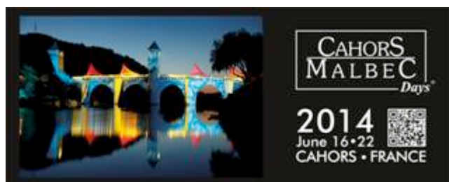
Visuel de présentation du programme des Cahors Malbec Days, 2014.

2014). Mais dans sa région d’origine, entre Bordeaux et Toulouse dans le sud-ouest de la France, le cépage malbec n’a été mis en avant sous ce nom qu’assez récemment, dans la seconde moitié des années 2000. Ce changement sémantique et stratégique en matière de communication était alors directement relié à ce qui venait de se passer de l’autre côté de l’Atlantique. L’idée était en effet de rendre visible le vin de Cahors sur les marchés internationaux en capitalisant sur le succès de l’industrie viticole argentine. À la fois originale et reflet de son temps, cette stratégie est désormais entrée dans les manuels de marketing français (Castaing, 2013 : 49-56). Elle s’est matérialisée sous de multiples formes, des étiquettes sur les bouteilles à l’ouverture d’un lieu de dégustation en ville (la Villa Cahors Malbec), en passant par l’organisation d’un événement de grande ampleur dédié au malbec, les Journées internationales du malbec, en 2008.