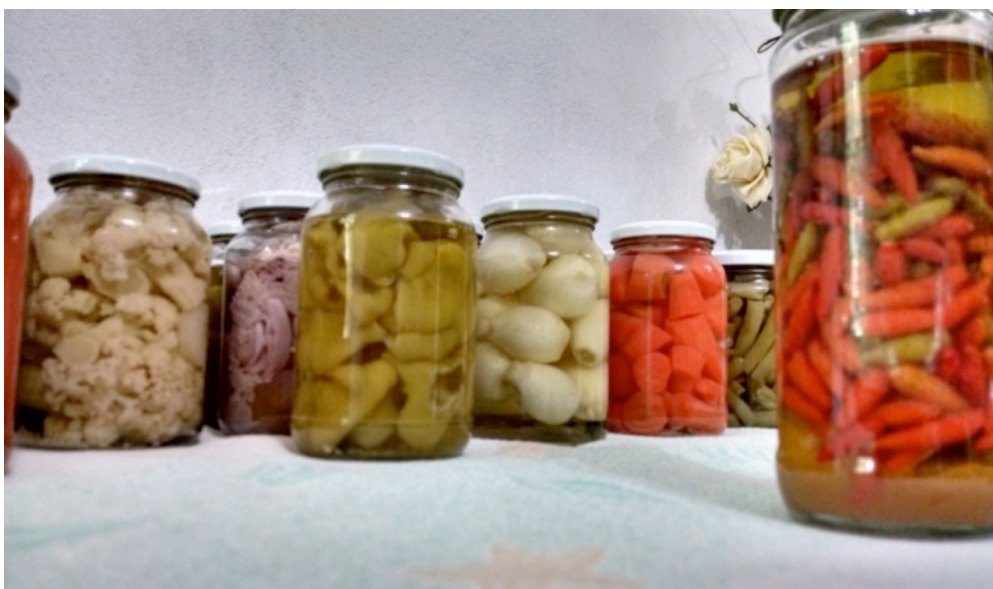
Imagem 1. Produção artesanal de conservas no município de Antônio Carlos

industrializado é quando tu tens uma empresa, igual eu [...], eu até posso dizer que meu produto é industrializado, só que o meu vêm direto da roça, e o dele, ele compra, aí já é uma segunda parte que ele faz, não vêm direto dele, não vêm da colônia. Se eu vendo meu produto pra ti industrializar então quem tá produzindo a mercadoria sou eu. Você só está industrializando, eu não, eu estou produzindo e industrializando, então eu considero colonial.