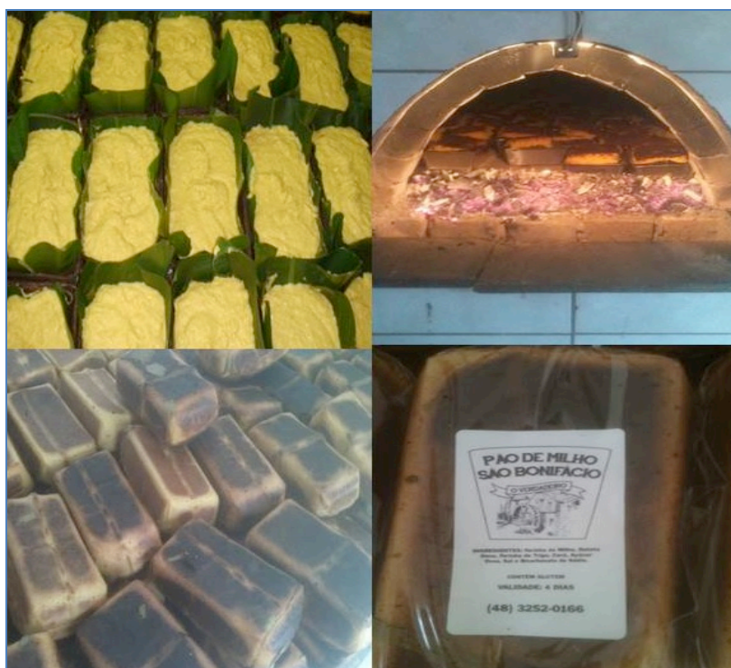
Imagem 2. Produção artesanal de pão de milho no município de São Bonifácio