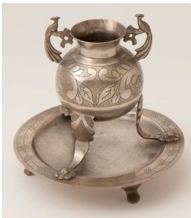
Figura 4. “Mate coquimbano”, siglo XIX

Fuente: Museo de Artes Decorativas, en exhibición, Sala n° 2, vitrina mate, bombilla y estribo. Colección platería. N° de inventario: 24.83.216. Plata, fundido, martillado, grabado al buril. Alto 14 cm, diámetro 14 cm.