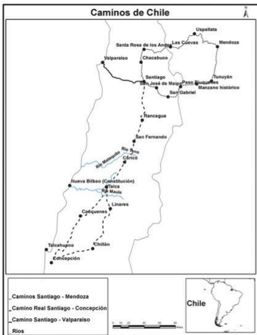
Figura 1. Mapa de los caminos de Chile. Siglos XVIII-XIX

exportación de los jesuitas no superaba el cupo máximo autorizado de 12.000 arrobas anuales. A sabiendas de la marcada inclinación de los jesuitas por cultivar la yerba caaminí (sin palos), conocida como el tipo más elitista y por ende costosa, es indudable que la producción de las reducciones se volcó hacia los mercados del Alto Perú y el Pacífico, con su atrayente cobertura en moneda metálica, donde se prefería esa calidad más seleccionada y cara de yerba mate (Sempat Assadourian, 1982: 73).