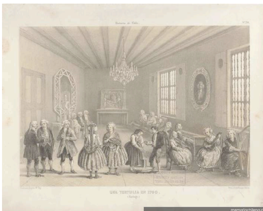
Figura 5. Claudio Gay, “Una tertulia en 1790”