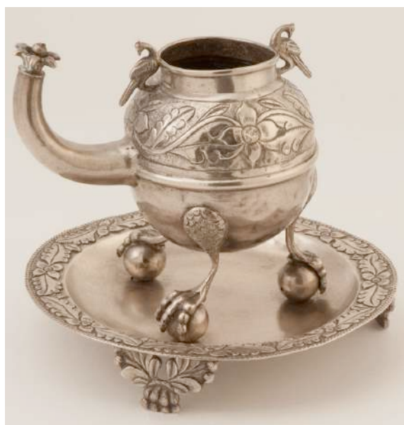
Figura 3. “Mate coquimbano”, siglo XVIII-XIX

Fuente: Museo de Artes Decorativas, en depósito. Colección: Platería. N° de inventario: 24.83.218.