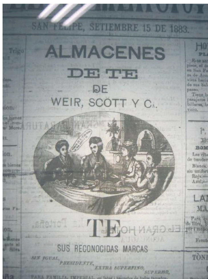
Figura 6. Aviso de té (en portada)