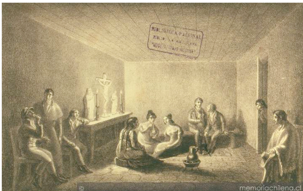
Figura 2. Peter Schmidtmeier, "Tertulia and mate party"