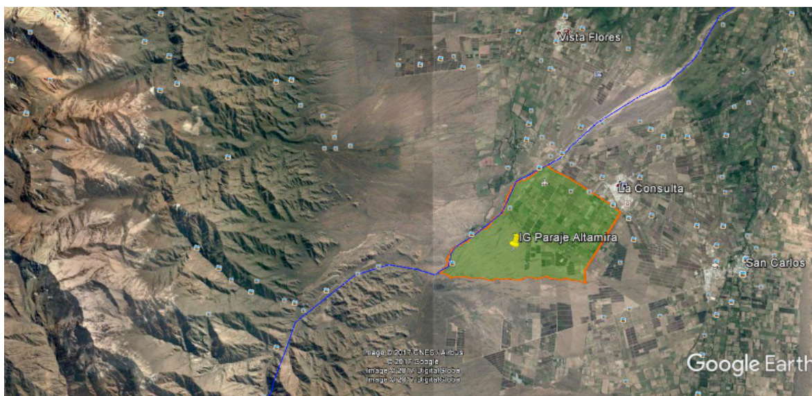
Imagen 1. IG Paraje Altamira

Paraje Altamira representa una de las primeras y más importantes Indicaciones Geográficas de América Latina. Sus vinos han alcanzado reconocimiento en los mercados y en la comunidad de sommeliers y enólogos. Los principales organismos de investigación de Argentina han estudiado el tema; y buena parte de las principales empresas vitivinícolas se ha interesado vivamente en el mismo. En 2013 la IG Paraje Altamira fue reconocida oficialmente por el Instituto Nacional de Vitivinicultura de Argentina, y emerge como un caso de liderazgo regional en el proceso de valoración de los vinos por su lugar de origen.