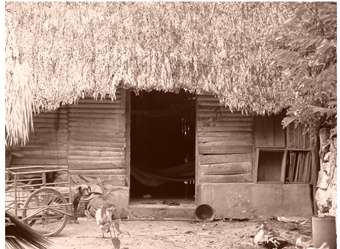
Foto 1. Choza en Pac-Chen, Quintana Roo.