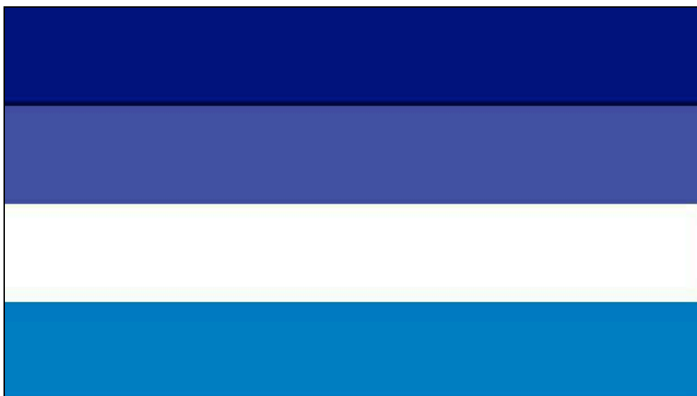
Figura 3. Bandeira do movimento g0y.

No entanto, nesse campo da teologia, apesar das reflexões de Wiik (2012) não apresentarem imprecisões, torna-se parcial nesse sentido que a teologia/filosofia “g0y”, se é que pode-se usar literalmente essa expressão, pode até ter sido importante como embrião desse movimento contra cultural que precisava legitimar-se perante aos seus semelhantes e principalmente esquivar-se da ideia de pecado, interpretado pelos cristãos protestantes mais ortodoxos. No entanto, essa teologia ressaltada nos Estados Unidos, com certeza foi-se diluindo, esvaindo-se, ou até mesmo tornando-se difusa na medida que os preceitos e comportamentos g0ys foram difundindo-se para os demais países ocidentais – de maioria católica.