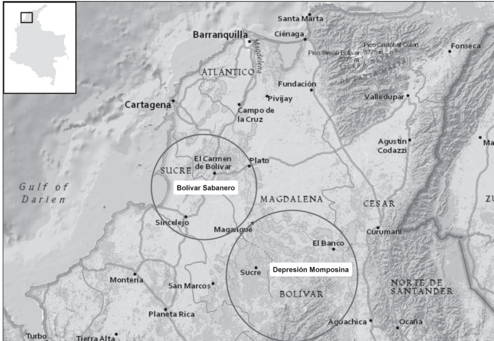
MAPA 1 | Área de estudio: Caribe Sabanero Siglos XVI, XVII y XVIII

finalizada la presentación del proceso de cimarronaje y la constitución de palenques en el Bolívar Sabanero y en la Depresión Momposina, se culminará con una reflexión sobre estos procesos organizativos como una herramienta de resistencia frente al sistema colonial esclavista.