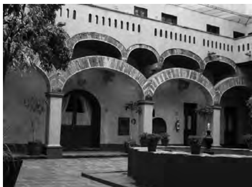
Imagen 3. Ex-convento de la Purísima Concepción, Puebla, Puebla.

Por su parte, la socióloga Marcela Lagarde (2003) sostiene que el atávico encierro de la mujeres va relacionado directamente con el ejercicio del poder del varón o androcentrismo de la estructura social, el que, bajo esquemas de dominación tradicionales, ha confinado a la mujer a dichos espacios. No se debe olvidar las herencias de las grandes haciendas y mayorazgos que fueron reservadas para primogénitos o hijos varones. Así, en el enclaustramiento la mujer desarrolla labores de curación, de cocina, educación, entre otros, que distan mucho de otras actividades como las académicas, políticas e intelectuales vinculadas al espacio externo o público de los varones.