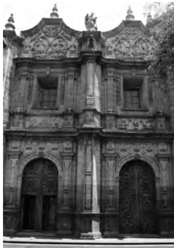
Imagen 5. Puertas "gemelas" del Ex-convento de Santa Rosa María, Morelia, Mich.

Siempre que se habla de varias de estas ciudades, es inevitable relacionarlas con sus fundaciones monásticas -tanto de frailes como de monjas-, algunas han logrado conservar estos inmuebles de tal manera que ahora son consideradas como ciudades coloniales y patrimonio de la humanidad por la categorización que hizo la UNESCO, como es el caso de Querétaro, urbe con investigaciones notables sobre la importante contribución de los conventos novohispanos a su traza y paisaje actual. Esta ciudad también es de los pocos casos de los que se ha documentado la evolución urbanística de las metrópolis novohispanas, que recibió parte de su traza y actual paisaje debidos a la presencia de sus conventos femeninos.