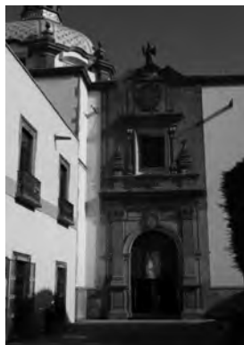
Imagen 4. Una de las puertas "gemelas" del Ex-convento de Santa Clara, Querétaro, Qro.

visuales y espacios con funciones muy específicas. Así, San Jerónimo, a quien se le atribuye la imposición de ciertas condiciones para originar el encierro, indica que las mujeres deberían llevar una vida completamente ascética. Proponía que los padres ofrecieran a sus hijas vírgenes y a concentrarlas en el monasterio donde no viesen otra cosa que las desviara de la virtud.