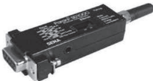
Figura 2. Adaptador inalámbrico paraniSD1000.

El adaptador utiliza directamente el servicio del puerto serie a través de la función RFCOMM (Radio Frequency Communication). Una de las ventajas del módulo inalámbrico es que permite eliminar el cable de comunicación entre el PC y los PLC correspondientes usando para ello el puerto serie HostLink. Algunos modelos del fabricante OMRON compatibles con este puerto son: CPM1 + CIF01, CPM1A + CIF01, CPM2A, CPM2A + CIF01, CJ1M-CPU22. 10