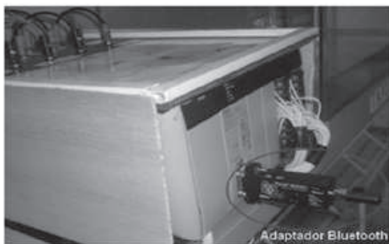
Figura 5. Implementación del adaptador Bluetooth al PLC.

Se puede observar en la Figura 6 cada uno de los objetos inteligentes o Wizards ubicados en la ventana de trabajo de Intouch, definidos con los respectivos tags correspondientes al proceso diseñado y a las variables de entrada y salida del PLC. El sistema cuenta con 5 entradas y 6 salidas; las dos primeras entradas corresponden a los pulsadores de INICIO y PARO. Las tres entradas restantes son los sensores de nivel de los tanques 2, 3 y el sensor óptico, respectivamente.