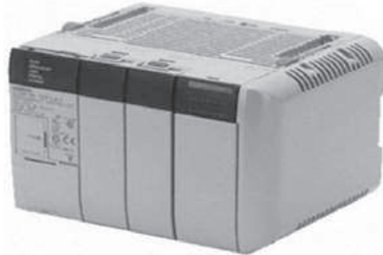
Figura 1. PLC CQM1H-CPU51.

Tal y como se observa en la Figura 1, el PLC utilizado para realizar la comunicación inalámbrica con el PC (computador personal) fue el PLC-OMRON modelo CQM1H-CPU51 con capacidad adaptación de hasta 512 entradas y salidas digitales, el cual cuenta con una gran flexibilidad en la configuración del sistema; a su vez es modular y permite un control distribuido mediante el uso de la función incorporada “ Controller Link ”. 9