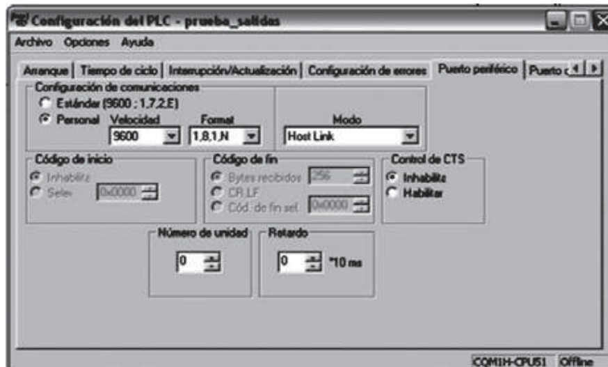
Figura 3. Configuración del PLC en Cx-Programmer.

Para el buen funcionamiento en la comunicación fue necesario cambiar el puerto de comunicaciones a la misma velocidad en la que se configuró el adaptador Bluetooth; para tal caso se utilizó un valor de 8 bits de datos, un bit de stop y sin paridad (es decir, 1, 8, 1, N). La configuración en el modo Host Link se ilustra en la siguiente figura.