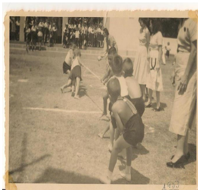
Figura 6: Aula de educação física, 1953.

Era comum as educadoras envolverem as crianças em atividades de competição, porque exigiam das crianças bastante energia. Elas gostavam de participar desses eventos porque requeria delas muito movimento e disposição para resolver os desafios. As gincanas, como eram conhecidas, envolviam brincadeiras previamente planejadas. Cada qual tinha o seu objetivo, conforme os fundamentos da pedagogia: toda a ação tem o seu propósito, sua finalidade.