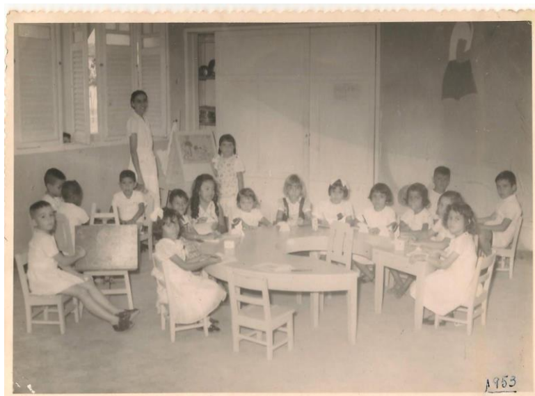
Figura 3: Atividade em sala de aula, 1953

O espaço denuncia a materialização dos pressupostos da escola ativa pelo desenvolvimento de uma atividade manual, pela experimentação de materiais didáticos que motivam as crianças pela interação com pranchas de pincéis, tintas, telas e dobraduras. Atividades que possibilitam a criatividade e o raciocínio lógico, supervisionadas por adultos que coordenam e orientam, mediante a necessidade de aprendizagem de cada aluno. No caso da sala de aula em evidência, há a presença de educadora que se dispõem a estar junto de seus alunos.