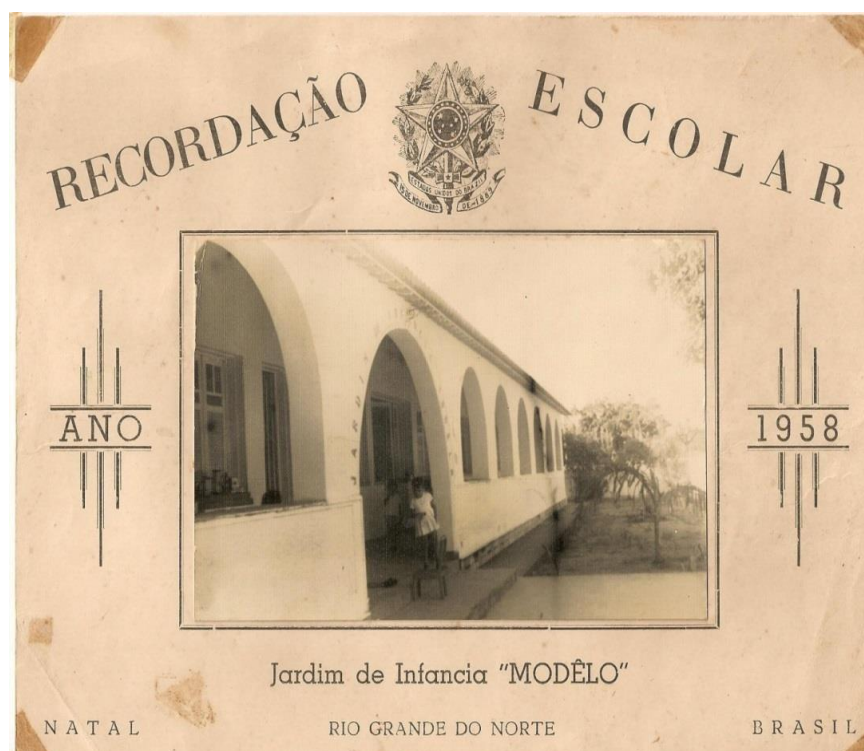
Figura 2: Fachada do Jardim de Infância Modelo de Natal – RN

A seguir, na Figura 2, podemos observar a imponente arquitetura da fachada do prédio, que ostentava estrutura em grandes arcos, com finalidade de sustentar o alpendre frontal da edificação. Notemos o equilíbrio na simetria pela disposição de seis arcos em cada lado e a disposição de um portal central, lugar por onde as crianças, familiares e professores tinham acesso a instituição.