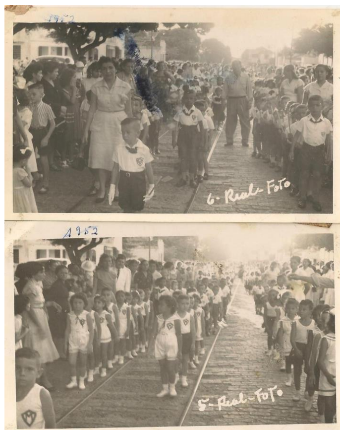
Figura 5: Desfile Cívico, 1952.

passeavam fardados pelas principais ruas do bairro da Ribeira, representando a instituição. O conclave tinha maior repercussão que a semana da criança, pois apresentava visibilidade social para a comunidade, tinha por objetivo iniciar os infantes no culto aos símbolos patrióticos e a reverência à pátria.