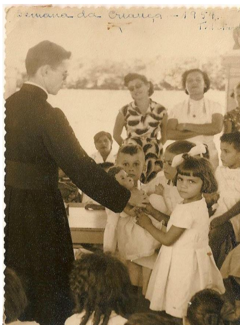
Figura 4: Batismo de Bonecas na semana da criança, 1954.

Na Figura 4, vemos a realização de uma cerimônia religiosa bem atípica, porque trata-se de um “batismo de bonecas” realizado por um pároco que, anualmente, participava da semana da criança. A festividade demonstra o quanto a religiosidade apresenta-se como elemento formador e o ato de benção dos brinquedos dissemina os valores cristãos para a vida social das crianças do Jardim de Infância Modelo de Natal. Na foto, observamos a presença da comunidade, sob o testemunho e aprovação dos familiares, presença das genitoras, em pé, em segundo plano.