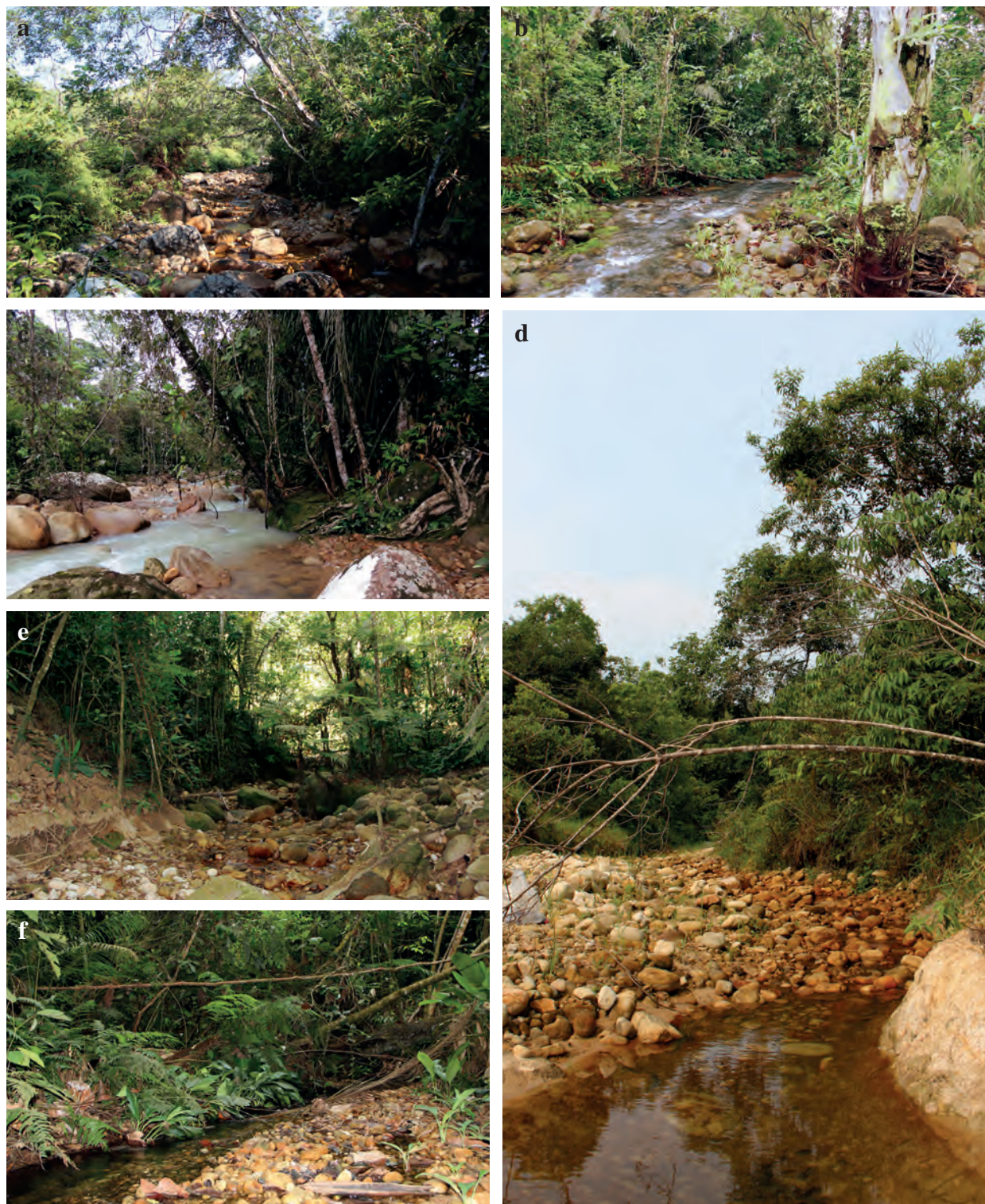
Figura 2. Quebradas muestreadas: a) Aguablanca; b) Resbalosa; c) Iglesiasia; d) Tauramenera; e) Limonera; f) Cajuchera.