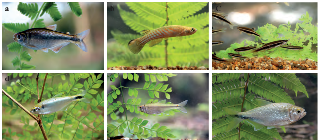
Figura 5. a) Bryconamericus sp.; b) Anablepsoides sp.; c) Copella eigenmanni ; d) Hemibrycon metae ; e) Bryconamericus cismontanus ; f) Astyanax metae .

A pesar que aún se tienen vacíos de información en la composición y riqueza de la ictiofauna de las cuencas del piedemonte del Casanare que drenan hacia el río Meta (Casanare, Guachiría, Pauto, Cravo Sur, Túa, Upía y Cusiana), en los últimos años se ha incrementado considerablemente su conocimiento. Eso ocurre especialmente en la cuenca del río Cusiana que cuenta con mayor investigación (Mojica 1999,