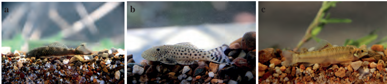
Figura 6. a) Chaetostoma dorsale ; b) Chaetostoma cf. milesi ; c) Characidium gr. boavistae .

Urbano-Bonilla y Zamudio 2008, Urbano-Bonilla et al. 2009, Villa-Navarro et al. 2011). Los resultados de este trabajo aumentan el número de especies para la cuenca media del río Cusiana en 26, para un total de 141 (Figura 7). En estudios previos Trujillo et al. (2011), con datos de riqueza de especies, endemismos y amenazas, se categoriza la zona de piedemonte de la cuenca del río Cusiana como un área de alto valor para la conservación. Sin embargo, se debe prestar atención a las demás: Guachiría, Casanare, Upía, Túa, Pauto, Cravo Sur, debido que no han sido ampliamente investigadas y muy seguramente presentan una riqueza íctica regional importante, por lo tanto, pueden estar siendo subvaloradas en términos de áreas de conservación.