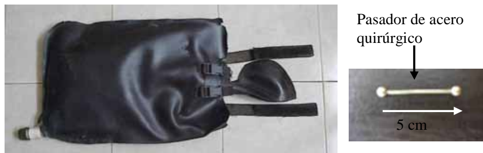
Figura 2. Bolsa colectora fijada a la bolsa de soporte que va sujeta a un arnés. (Collecting bag fixed to supporting bag which will be attached to a harness).

Al final de los dos últimos períodos de muestreo después que se quitaron las bolsas se notó una ligera inflamación en el área donde se introdujeron los pasadores. En el experimento debido a problemas con la cicatrización, en el período de adaptación se