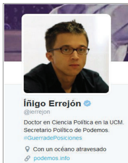
Fig. 2: Perfil de @ierrejon [8]