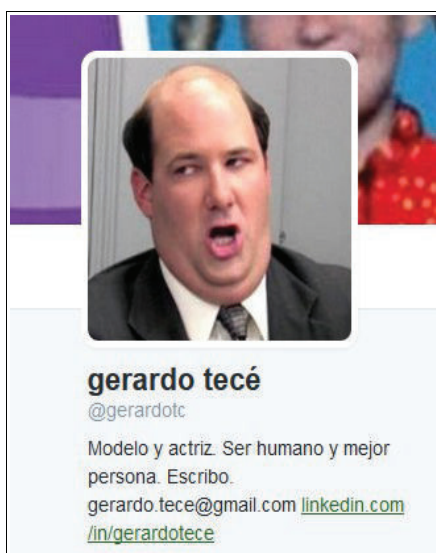
Fig. 1: Perfil de @gerardotc [7]

En tercer lugar, también es importante durante el análisis de la construcción del ethos discursivo en Twitter el estudio de la biografía con la que se presenta al usuario. En esta, se puede exponer una declaración de intenciones explícita o implícita de lo que se pretende hacer con dicho perfil (fig.1), enmarcarse dentro de una ideología (fig. 2), o jerarquizar una serie de preferencias y aficiones que condicionarán a posteriori la temática de los tuits .