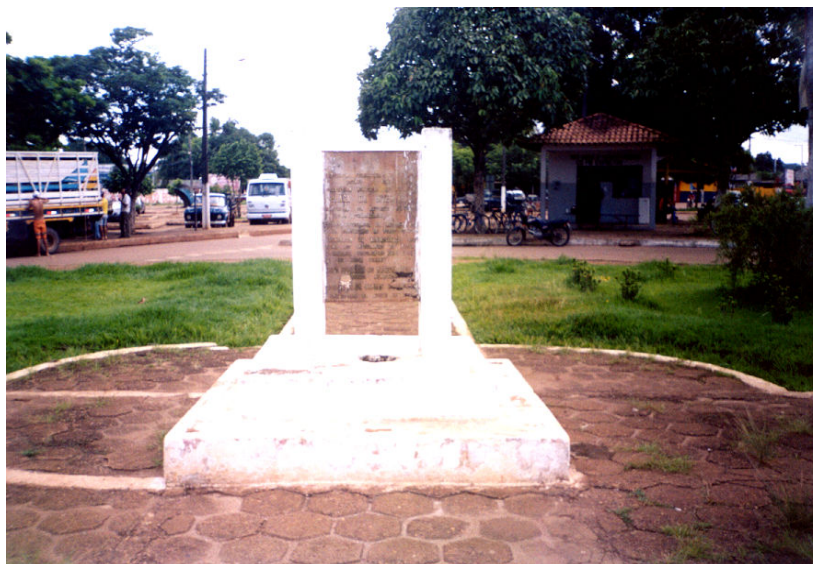
Figura 2. “Monumento da Integração”, no centro da cidade de Altamira

cidade, ao lado do mercado, em uma das ruas mais movimentadas pela circulação de pessoas e tráfego intenso na entrada e saída de Altamira [19].