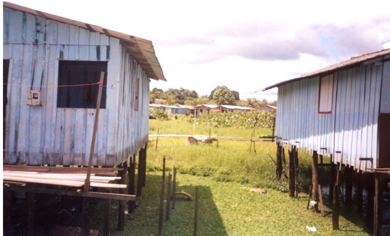
Figura 4. Moradias no Bairro Açaíçal (Igarapé Altamira)