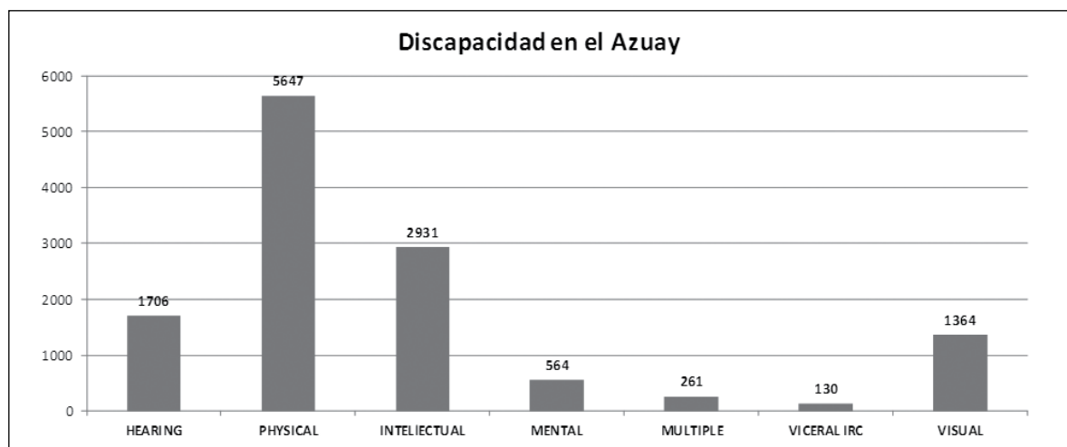
Fig. 1. Discapacidades en el Azuay organizado por tipo. [1]

.Estos datos son de mucha importancia, inclusive se puede tener nuevas categorizaciones en función de género y edad, siendo los adultos mayores quienes por diversas circunstancias presentan varios tipos de discapacidad, incluso múltiples.