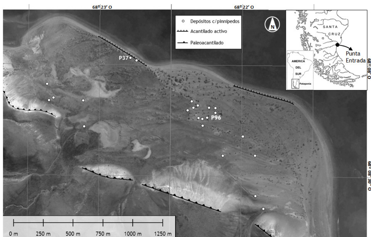
Fig. 1. Ubicación de los depósitos con restos de pinnípedos en Punta Entrada.

apostaderos de pinnípedos. Por último, se evalúa el papel de esta localidad en los circuitos de movilidad de los cazadores recolectores de la región durante los últimos 2.000 años.