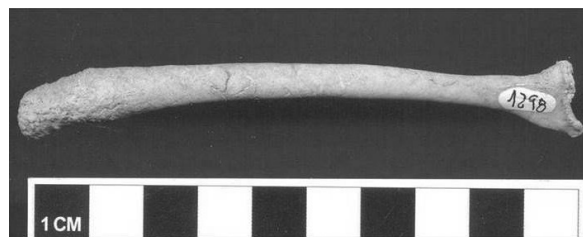
Fig. 4. Báculo o hueso peniano de A. australis recuperado en P 96.

El perfil de representación de partes esqueléticas de ambos conjuntos incluye todas las unidades anatómicas (Fig. 5), pero existen diferencias entre ellos. En P 96 las extremidades tienen la representación más alta, seguidas por el esqueleto axial (especialmente mandíbulas y costillas) y, por último, las aletas. El perfil anatómico que presenta P 37 es coincidente con estas proporciones relativas, pero se diferencia claramente de P 96 en que los miembros anteriores tienen una representación muy superior a los posteriores: los elementos de las extremidades anteriores (húmero MNE 55, escápula MNE 53) duplican a los correspondientes a las extremidades posteriores (Fémur MNE 23, Tibia MNE 19). Esta sobrerrepresentación de los miembros anteriores no puede explicarse a partir de la destrucción diferencial (Muñoz et al. 2013), ya que los elementos de ambas extremidades tienen un rango de resistencia comparable (Borella et al. 2008), por lo que posiblemente sea un efecto del muestreo. La representación anatómica de ambos depósitos es consistente con un escaso transporte