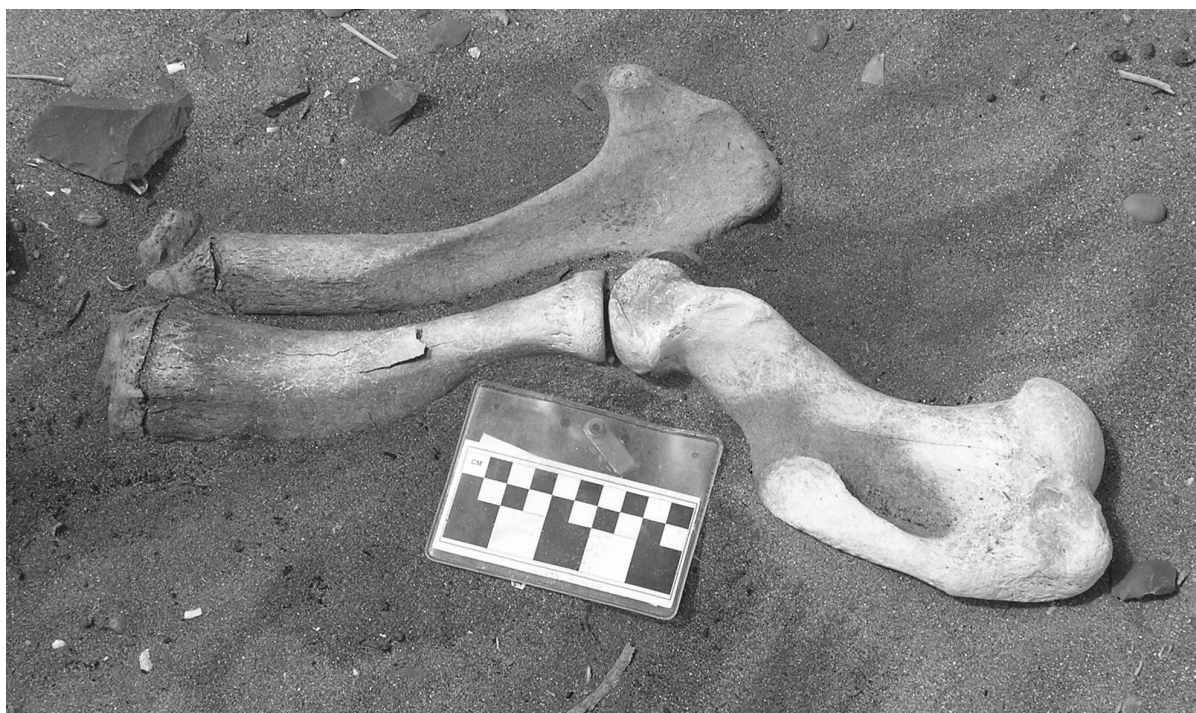
Fig. 3. Huesos articulados registrados durante la recolección de 2006 en P 96.

materiales a las condiciones subaéreas. En P 96 el 37% del NISP de pinnípedos presenta fracturas, pero esto no afecta su identificación taxonómica ya que los especímenes corresponden a porciones que abarcan gran parte del elemento. Además, el índice de fragmentación de este depósito es muy bajo (NISP/MNE 1,5). En P 37, aunque la fragmentación tampoco es alta, es mayor que en P 96 (NISP/MNE 2,6), lo cual es acorde con el perfil de meteorización más avanzado de este conjunto. En lo que respecta a las modificaciones antrópicas, principalmente huellas de corte que afectan porcentajes bajos de especímenes, tampoco permiten suponer una gran destrucción durante el procesamiento de las carcasas (Cruz et al. 2011a; Muñoz et al. 2013, Cañete Mastrángelo et al. 2013). En síntesis, si bien existen diferencias en el tiempo de exposición, otras variables tafonómicas presentes en estos conjuntos son similares. Esto implica que aunque pudo haber factores que afectaran la representación de los taxones más pequeños o de los huesos más frágiles en P 37 debido a la meteorización, la integridad ( sensu Binford 1981) del conjunto de huesos de pinnípedos de ambos depósitos no ha sido